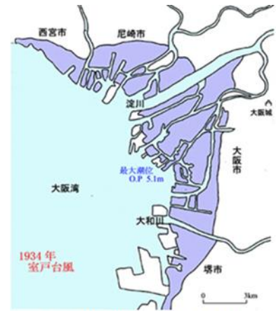
室戸台風による浸水区域

風速、潮位ともに超大型のもので、室戸で瞬間的には 60m/sec を記録したが、降雨は少なかった。西大阪一帯は浸水し、死者、行方不明者 1,888 人を数える大災害となった