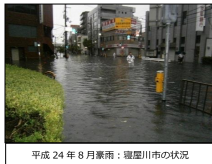
平成24年8月豪雨：寝屋川市の状況