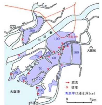
第 2 室戸台風による浸水区域

特に、大阪湾沿岸では、地盤沈下により機能低下した防潮堤を越波、あるいは溢流し、大きな被害をもたらした。西大阪の内陸河川では、高潮による越波、溢流および一部河川堤防の破損のため、西淀川、港、此花、福島、北、西、大正、西成の西大阪各区のほか、城東区、都島区にわたって浸水し、大阪市の浸水域は 31km 2 に達した。