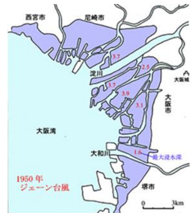
ジェーン台風による浸水区域

更に、高潮および越波によって大阪市域の 30%に相当する 56km 2 におよぶ地域が浸水した。