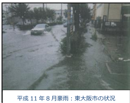
平成11年8月豪雨：東大阪市の状況