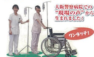
大阪警察病院での「現場の声」から生まれました!

医療機器の開発ニーズを医師が発表、技術を有する企業とマッチングする「次世代医療システム産業化フォーラム」で開発された医療機器