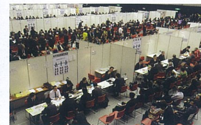
大手流通業が買い手としてブースを構え、全国の中小製造業・卸売業が売り手として参加する「買いまっせ!売れ筋商品発掘市」

中小企業の販路開拓や大企業とのアライアンス支援に向け、規模・形態の様々な商談機会を提供し、新たな商都大阪を形成します。