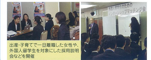
出産・子育てで一旦離職した女性や、外国人留学生を対象にした採用説明会などを開催

生産年齢人口の減少に対応するため、十分に活用されていない優秀な人材を発掘し、中堅・中小企業での戦力化につなげます。