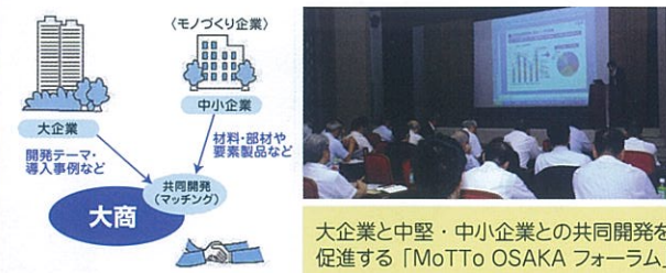
大企業と中堅・中小企業との共同開発を促進する「MoTTo OSAKA フォーラム」

大企業・中小企業や行政との連携を通じたオープンイノベーションを促進し、水・インフラ、エネルギー等の社会課題の解決を目指します。