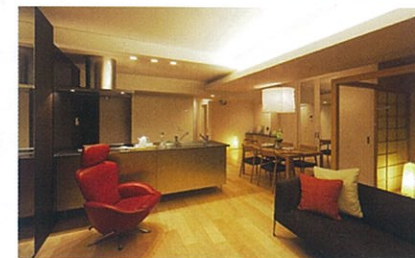
リノベーションによる整備のイメージ(「リノベッタ」プロジェクト(喜多俊之氏プロデュース)の一例)

「暮らしの器」である住まいを上質な空間にすることで暮らし産業(生活関連産業)の内需を拡大する企業運動など、多角的な活動を展開します。