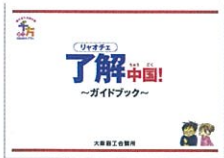
中国人観光客の接遇ガイドブックを作成し、小売店・飲食店のスタッフを対象にした出前セミナーを実施

水・光・食を活用して都市の魅力を発信するとともに、国内外からの観光需要を取り込み、その経済効果を大阪全体に波及させます。