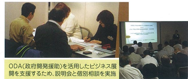
ODA(政府開発援助)を活用したビジネス展開を支援するため、説明会と個別相談を実施

国内から海外、海外から海外、海外から国内といったクロスボーダー事業を展開し、海外進出、販路開拓を支援します。