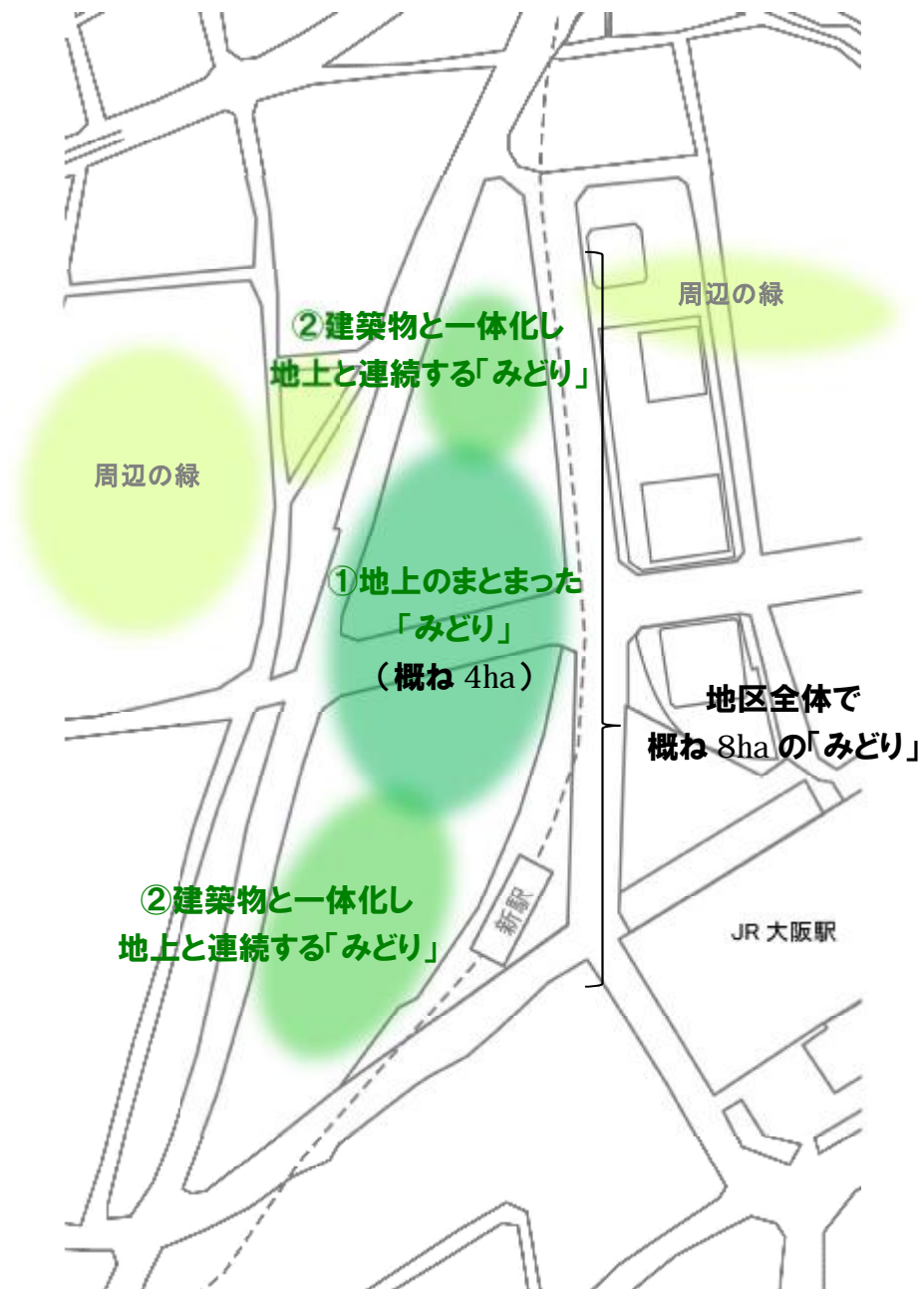
図-1 「みどり」の配置・規模