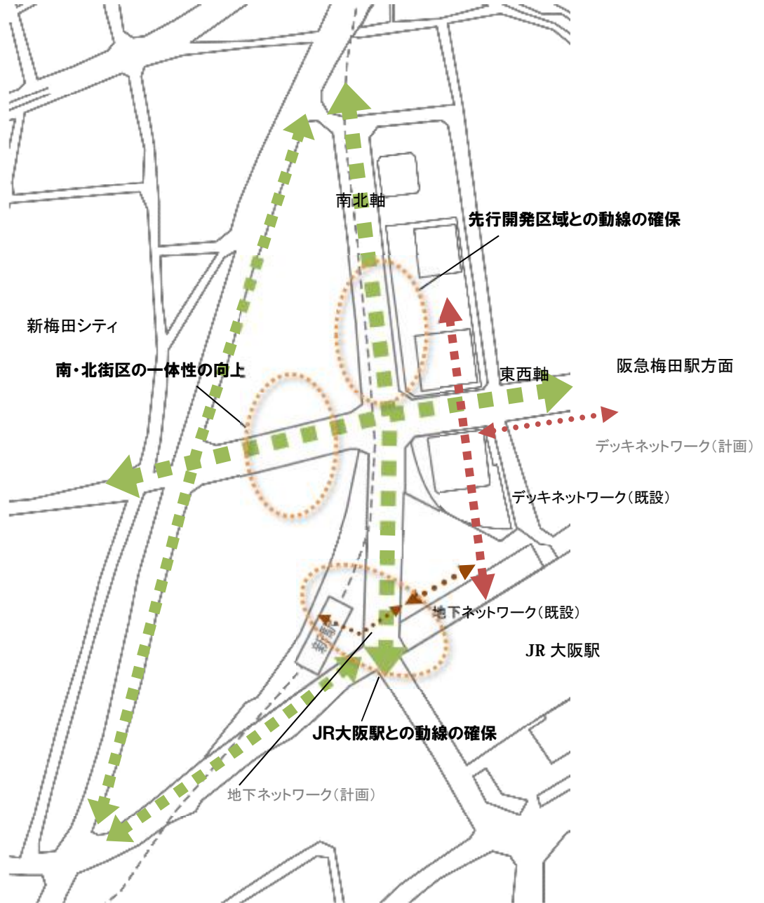
図-4 歩行者ネットワークの概念図