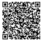
(新型コロナウイルス感染症対策版)