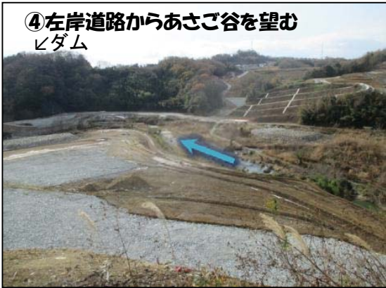
④左岸道路からあさご谷を望む ↓ダム