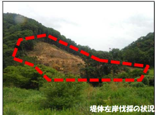
堤体左岸伐採の状況

工事用道路・仮置きヤードの整備は、図に示す通り、ロック材仮置きヤードとコアストックパイル周辺にて実施中です。