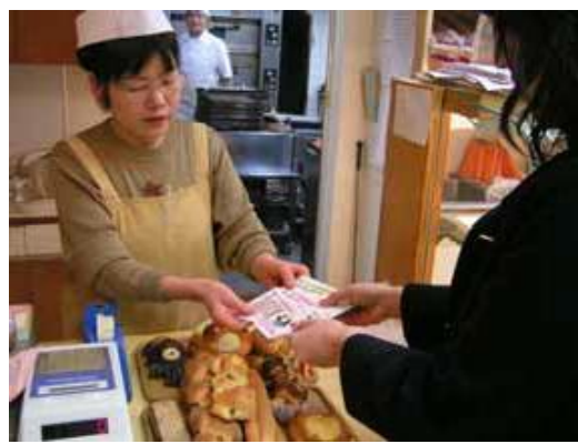
地元の商店街でお買い物(寝屋川市「げんき」)