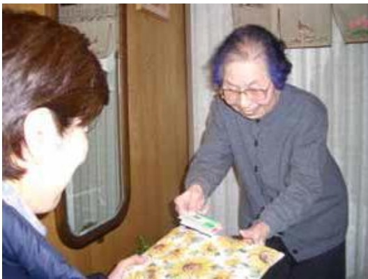
地域通貨でひろがる「地域のつながり」(吹田市「いっぽ」)

適用される規制の特例措置 : ・「地域通貨」を発行するNPO等への事前登録要件の緩和