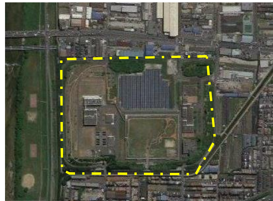
大井水みらいセンター(処理場)