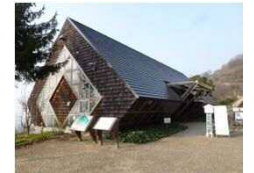
らくらくセンターハウス