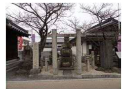
相撲開祖當麻蹶速の塚

○相撲の資料館です。 ○當麻蹶速（たいまのけはや）は日本書紀に記述のある、相撲の開祖と言われる人物です。