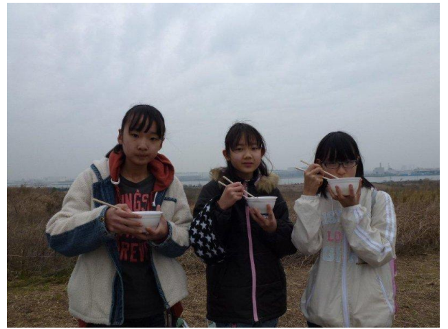
あったかいうどんて・・・ほっと笑顔が