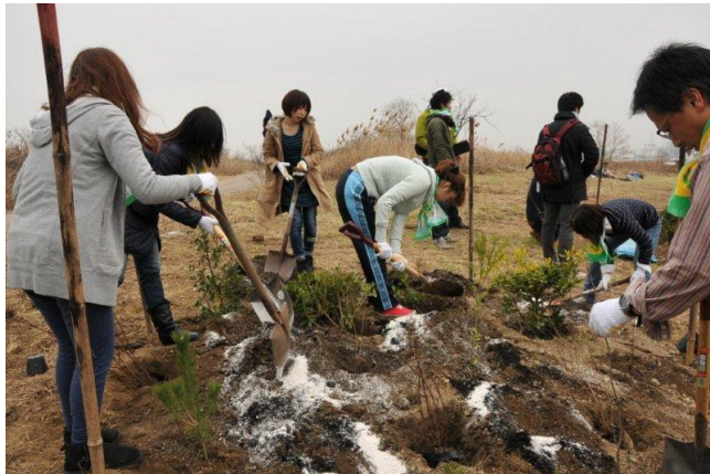
続いて参加者の皆さんで穴を掘って土づくりです