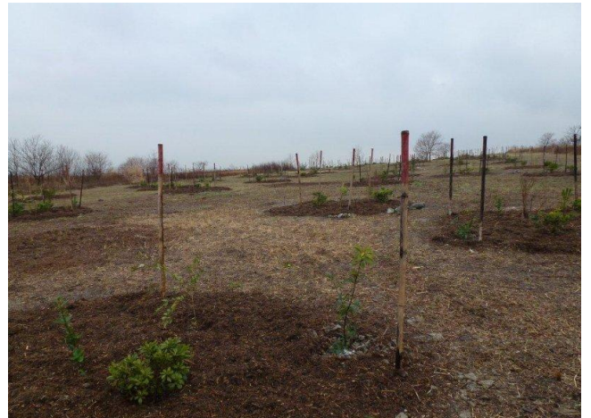
みんなで5,000㎡を植えました