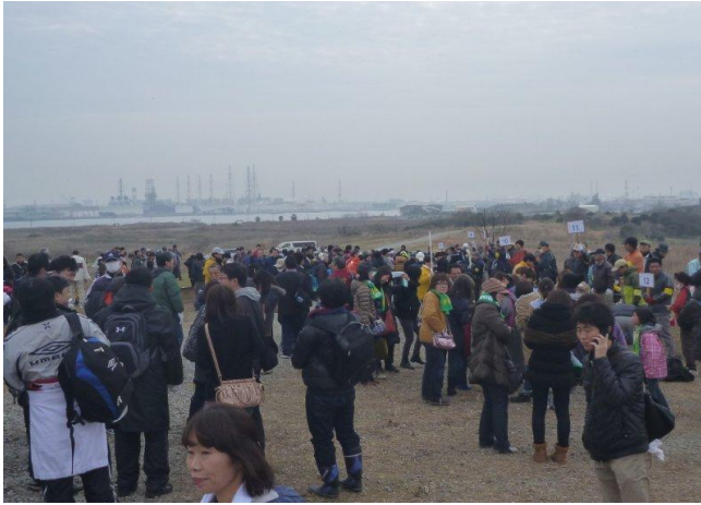
今年もたくさんの方にご参加いただきました