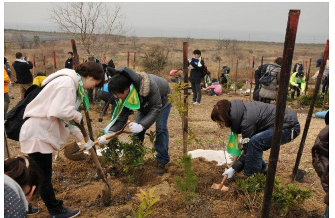
大きく育つことを願って、ていねいに植えます