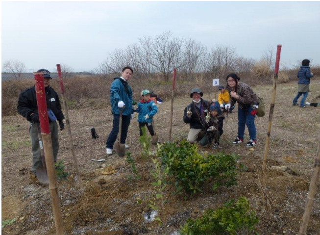
ご家族で植樹参加いただきました