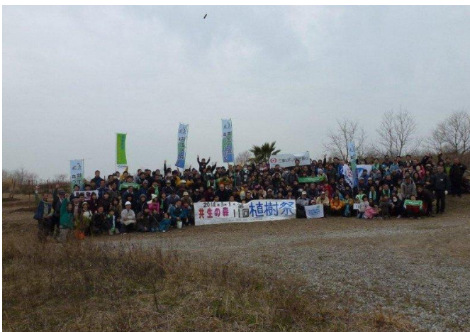
参加者全員で記念撮影を行いました