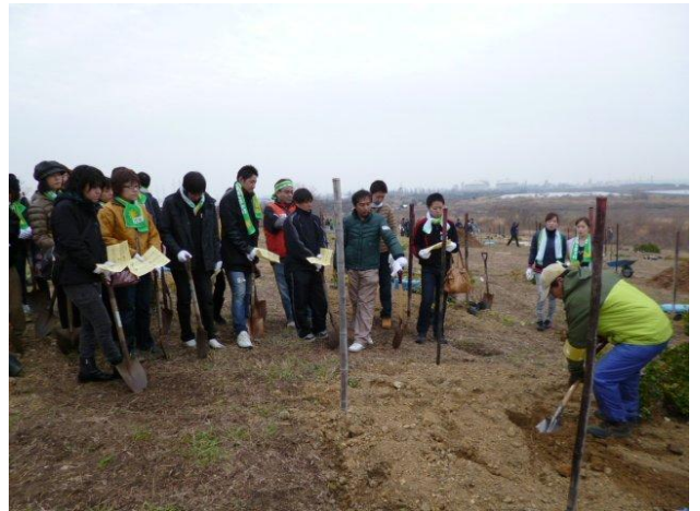
植え方を植樹リーダーが実演でご説明