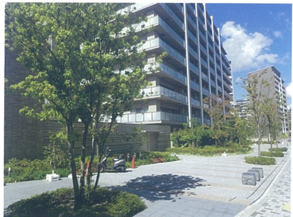
建築物入口前の歩道