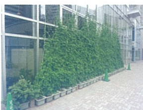
緑のカーテンの様子