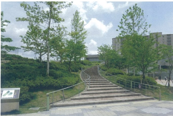
1階から屋上へ向かう動線上の緑化