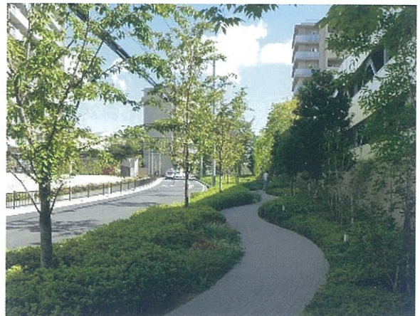
建築物外周部の遊歩道