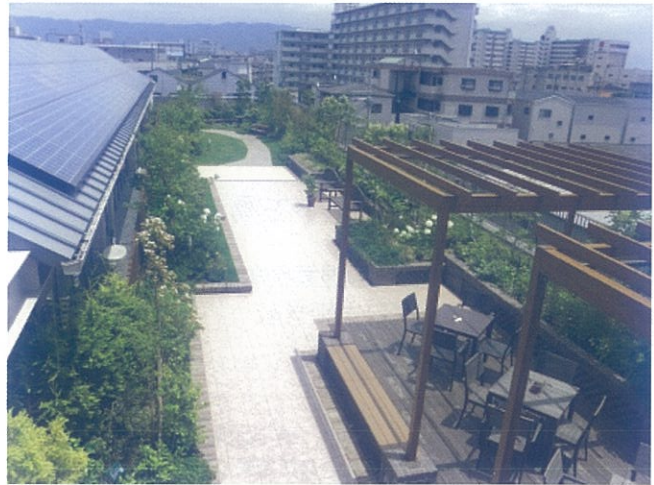
開放された屋上の緑化

住宅地が並ぶ一角に立地している施設です。屋上緑化や壁面緑化等、限られた敷地を効果的に活用し緑化しています。特に屋上緑化は、季節がイメージできる多彩な植栽により存在感あり、屋上の動線の工夫と多層植栽によりボリューム感を演出しています。屋上は自由に出入りでき、府民の憩いの場となっており、建築主が地域の緑化を積極的に力を入れています。