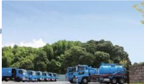
株式会社ケーシーエス