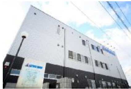
興徳ホールディングス株式会社