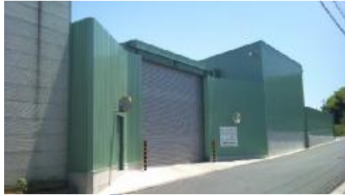
株式会社興徳クリーナー 尾生工場