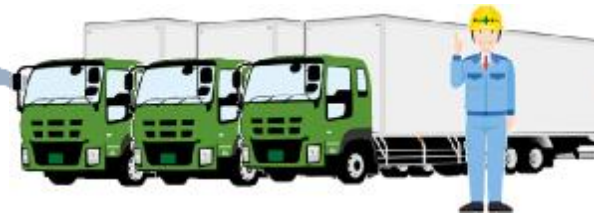
株式会社ケーシーエス・エス