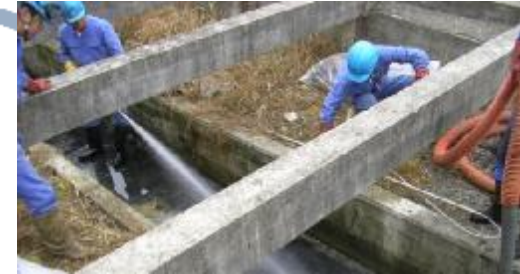
株式会社ユウシン