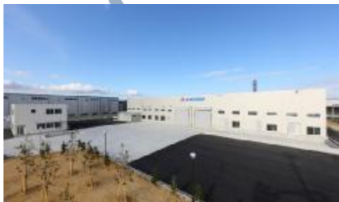
株式会社興徳クリーナー 岸之浦工場