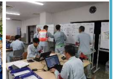
【地震・津波災害対策訓練】