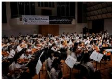
アジアユースオーケストラ (8月)