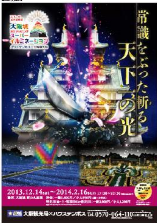
大阪城スーパーイルミネーションショー (12月～2月)