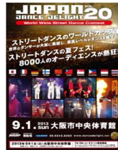
DANCE DELIGHT (9月)