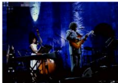
国際ジャズデー (4月)