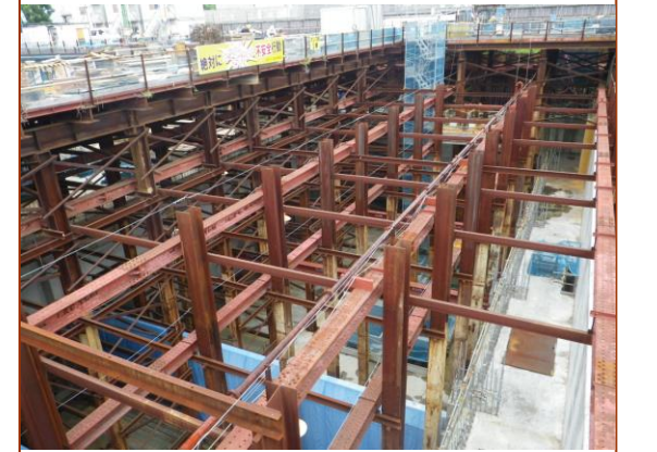
写真⑥—ポンプ棟Ⅱ期（底板基礎打設完了）