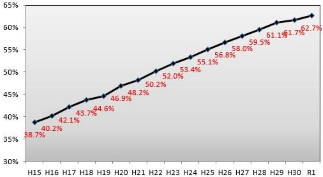
建築物のバリアフリー化の推移(民間施設)