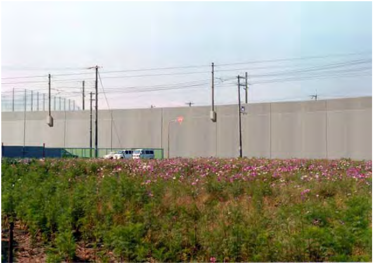
現行認可案の景観