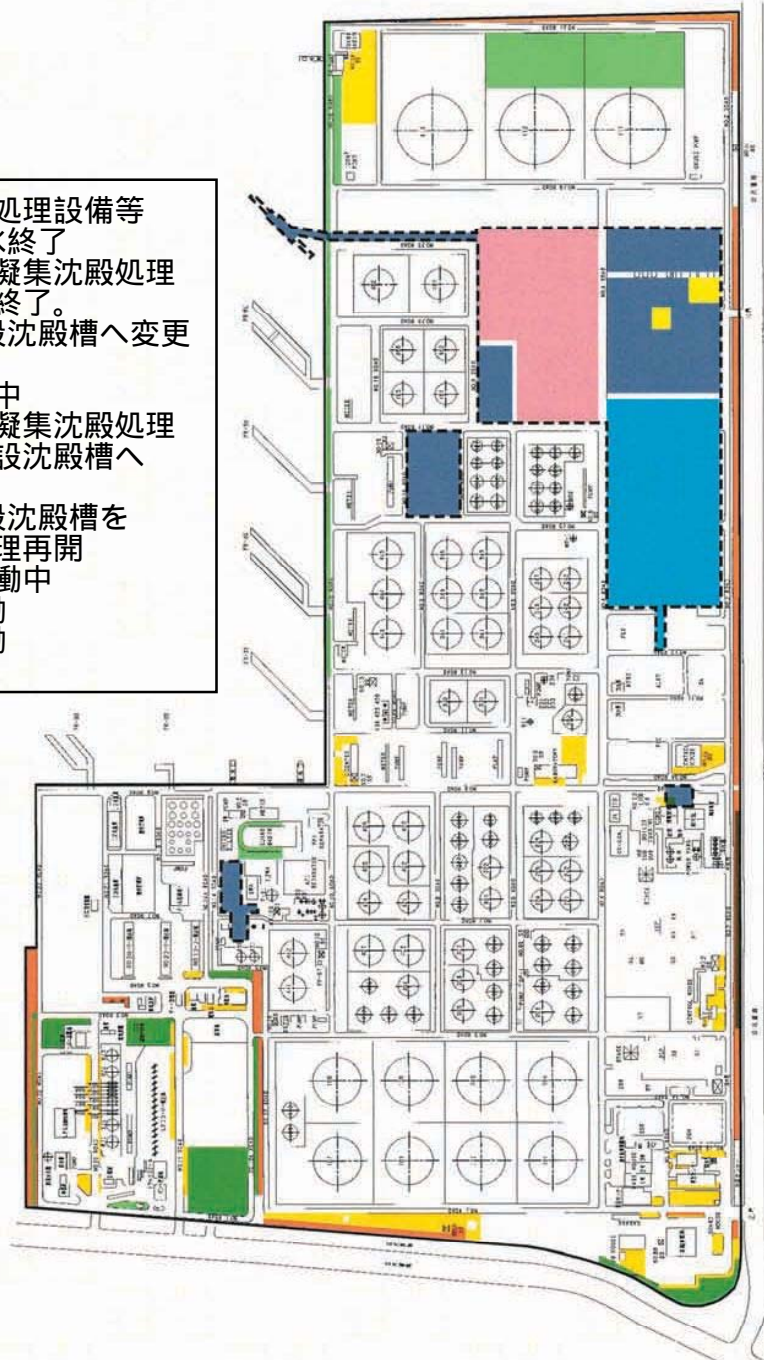
図-1. 仮設凝集沈殿処理設備等の設置場所（工事中）

仮設凝集沈殿処理設備等 10/18に排水終了 1/28に仮設凝集沈殿処理 設備の排水終了。 2月より仮設沈殿槽へ変更 予定。 9/9～稼働中 1/27に仮設凝集沈殿処理 設備から仮設沈殿槽へ 変更 1/26～仮設沈殿槽を 再設置し処理再開 12/10～稼働中 1/19～稼働 1/26～稼働