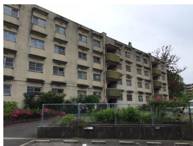
現況写真② 第3期対象敷地南側のB44棟 (現況配置図②から撮影)