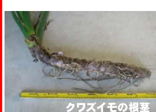
クワズイモの根茎