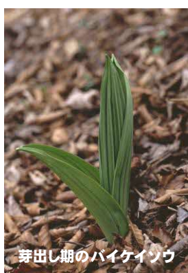
芽出し期のバイケイソウ