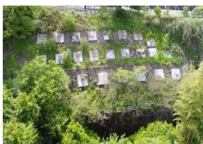
ドローンを活用した法面点検

南海トラフ巨大地震による津波や、近年増加している集中豪雨などの災害に対応するための対策を実施します。