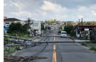
倒壊による道路閉鎖