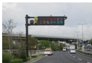
道路情報提供装置