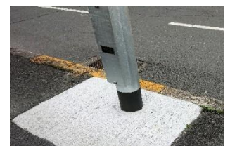
道路照明灯の更新