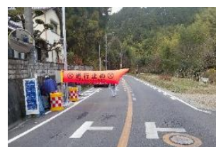
空気式遮断機による通行規制