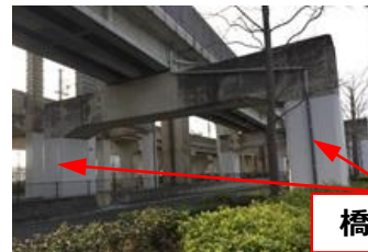
道路と鉄道が並走する箇所の耐震補強状況