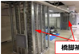
鉄道駅耐震補強の状況

鉄道利用者などの安全確保、および鉄道と交差・並走する広域緊急交通路などの機能確保のため、鉄道事業者が実施する耐震補強事業に補助を行います。