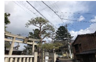
電線による景観阻害