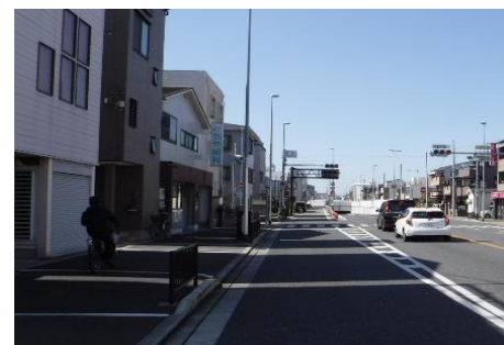
(都) 十三高槻線（吹田市）