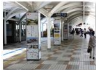
▲ 千里中央駅 連絡通路