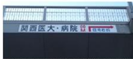
京都市守口線 市駅前横断歩道橋種島歩道橋

【実績】平成17年度から平成25年度までに11橋実施 〔金額換算で約5,000万円の費用を企業等が負担〕