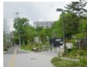
沿道の民有地緑化事例

みどりの風促進区域内の道路や沿道の民有地の緑化を進めることにより、府民が実感できるみどりづくりを創出するとともに、ヒートアイランド現象の緩和や官民一体となったオール大阪でのみどりづくりの取組みを進め、「みどりの風を感じる大都市・大阪」を目指しています。