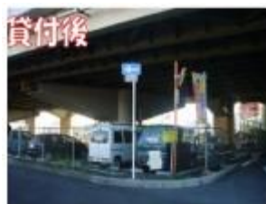
泉大津美原線高架下（和泉市）