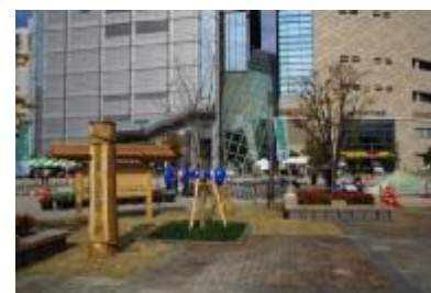
府民協働による道標の設置（緑の一里塚） 難波宮跡公園（大阪市）

URL: http://www.pref.osaka.jp/doroseibi/kakusyusesaku/rekishikaidou.html