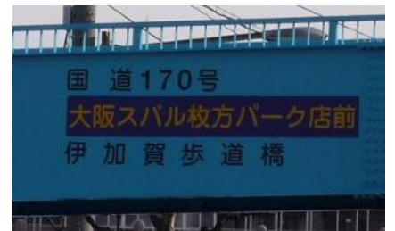
大阪スバル枚方パーク店前伊加賀歩道橋

道路施設の名称（通称）を命名する権利を企業等に売却することで、契約料を得るものです。得られた収入は道路の維持管理費に充当されます。平成21年度に第1弾として枚方市伊加賀緑町の伊加賀歩道橋を対象に公募を行った結果、「大阪スバル枚方パーク店前伊加賀歩道橋」（年額45.4万円 5年間）に決定し、平成23年度までに全5橋を決定しております。また平成24年2月より府内165橋の歩道橋を対象を拡大して随時受付を行っております。