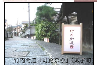
竹内街道「灯路祭り」（太子町）