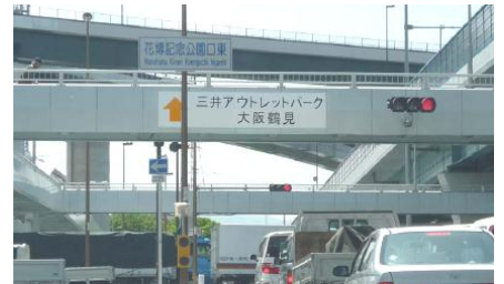
主要地方道大阪中央環状線 葺島歩道橋

平成17年度から実施しており、平成23年度までに10橋で実施しました。府民とかがわる様々な場面で、引き続き事業PRを実施し、歩道橋の適切な維持管理と交通の円滑化に寄与していきます。