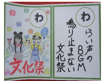
2018文化祭～やお北歌留多～ 図書委員+有志