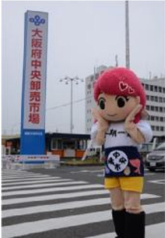
マスコットキャラクター せりちゃん