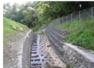
奥野々川 & 細谷川