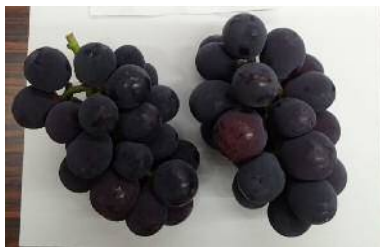
グロースクローネ

農の普及課では、品種や栽培方法など共通の課題に対して情報交換や農業者の交流の場を設定することが、今後の農業経営に重要であると考えています。