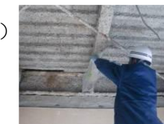
解体現場立入検査