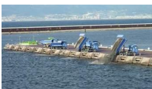
フェニックス処分場における廃棄物受入