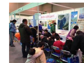
「フィッシングショー-OSAKA」における大阪湾の環境保全の啓発