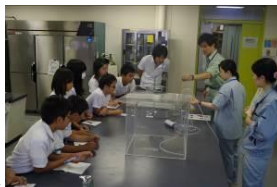
実験室「いこらほ」での環境学習