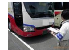
流入車規制立入検査