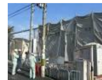
アスベスト解体現場パトロール