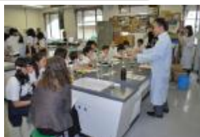
環境情報プラザいこらボ活動の様子