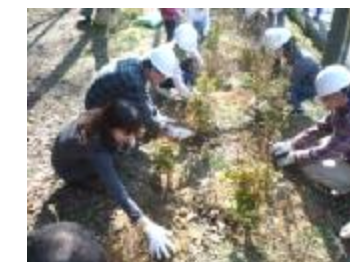
植樹風景 (生駒山系花屏風構想:交野市)