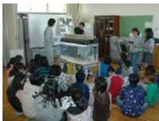
イタセンパラの出前講座の様子