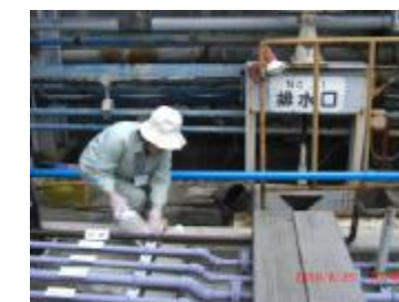
工場への立入検査