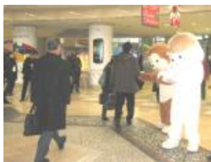
節電の呼びかけ(梅田地下街)