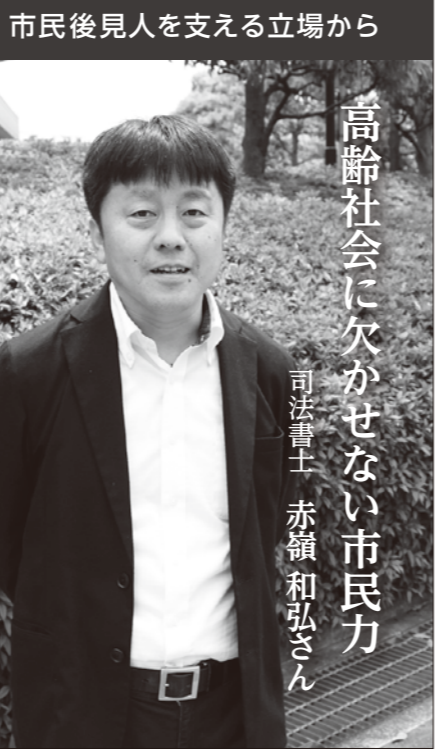
市民後見人を支える立場から

8月からスタートする市民後見人養成講座(令和2年3月までに13日間)で主に土曜日(開催)を受講するには、左記のオリエンテーションへの参加が必要です。 対象 25歳~69歳で市内在住 対象 25歳~69歳で市内在住 対象 25歳~69歳で市内在住 対象 25歳~69歳で市内在住 対象 25歳~69歳で市内在住