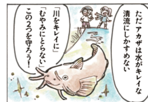
うのせ 鵜瀬みりさんの作品