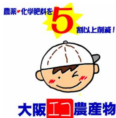
図-31 大阪エコ農産物認証マーク