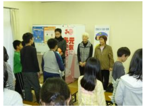
3日間お世話になったみなさんにお礼のあいさ