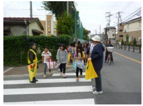
みんなで自治会館に移動