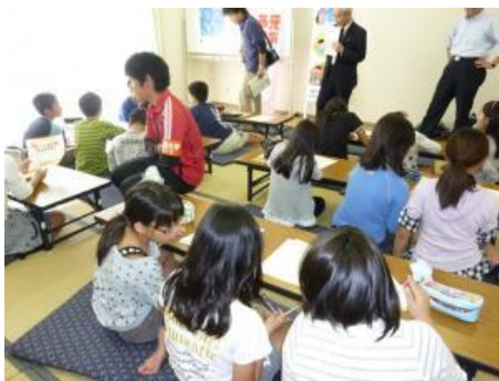
活動の目標を記入する参加者