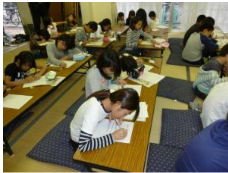
振り返りを記入する参加者