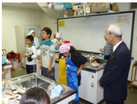
さあ食器も出しましょう