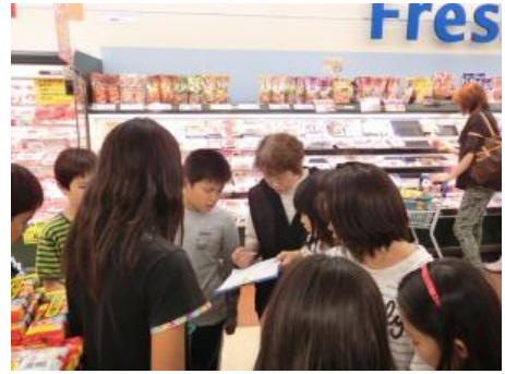
夕食の買い出しに行きます