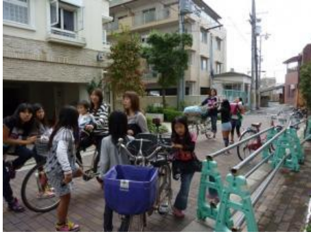
次々に集まってくる参加者と保護者