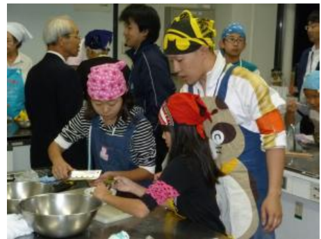
第2日の活動より 市立文化会館でみんなで夕食づくり