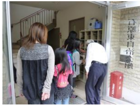
石原自治会館に集まってくる参加者