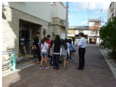
防災講座のため自治会館から石原東公園に移動