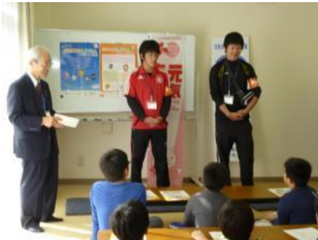
協力して下さる摂南大学法学部ゼミ生の紹介