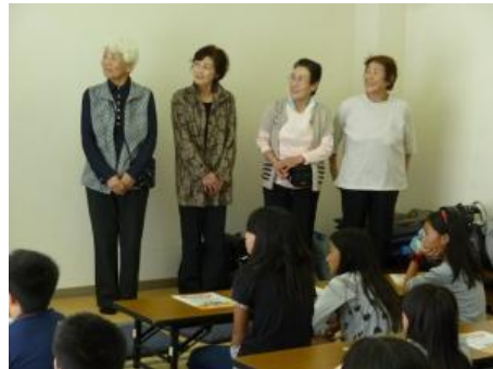
夕食や宿泊に協力して下さるシルバー人材センターのみなさんの紹介