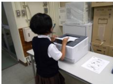
プリントを印刷します