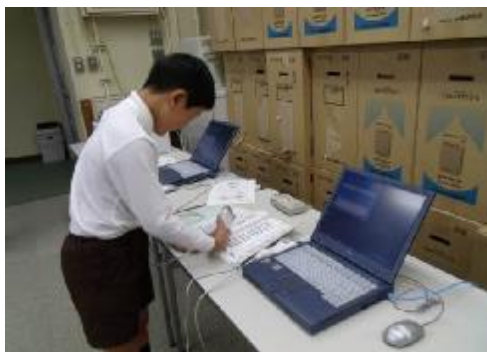
バーコードで、プリントを選びます