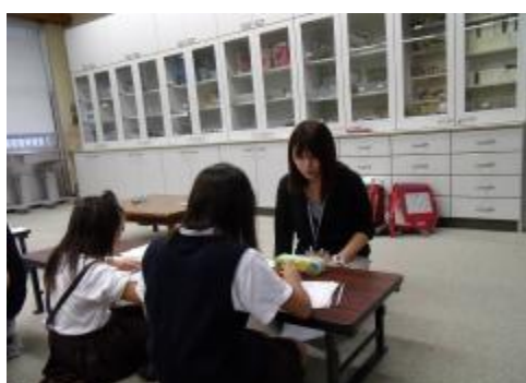
学習支援アドバイザーが見守ってくれます