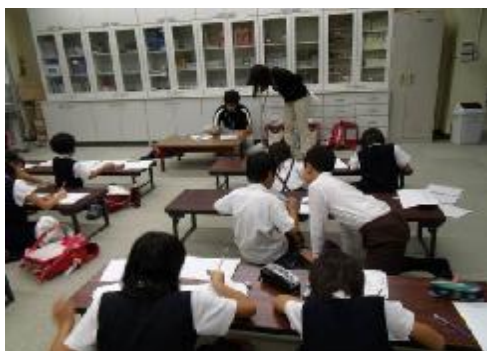
各自、プリントを解きます