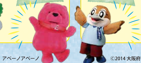
アペーノアペーノ