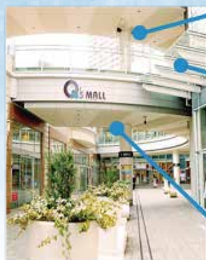
大阪市阿倍野区阿倍野筋一丁目6番1号 あべのキューズモール2階アペーノアペーノ

※大阪府クールスポットモデル拠点推進事業にて設置。同事業により、SENRITOよみうり（豊中市）、難波センター街商店街（大阪市）にも「クールスポット」が誕生しています。