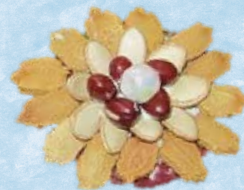
ブローチのイメージ