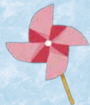
作成するおもちゃの一例