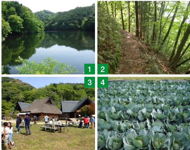
①河合新池(岸和田市相川町) ②泉州地域近畿自然歩道 ③紀泉わいわい村 ④キャベツ畑