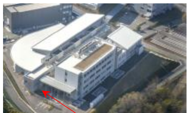
エントランスコート