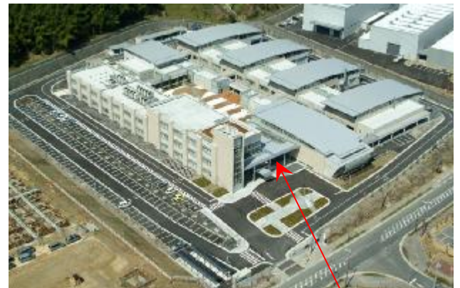
エントランスコート