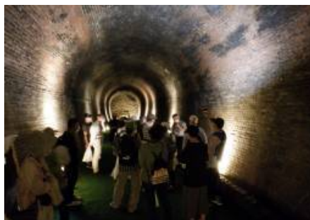
【旧国鉄関西線 亀の瀬トンネル見学の様子】