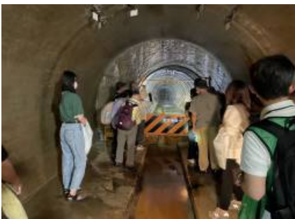
【排水トンネル見学の様子】